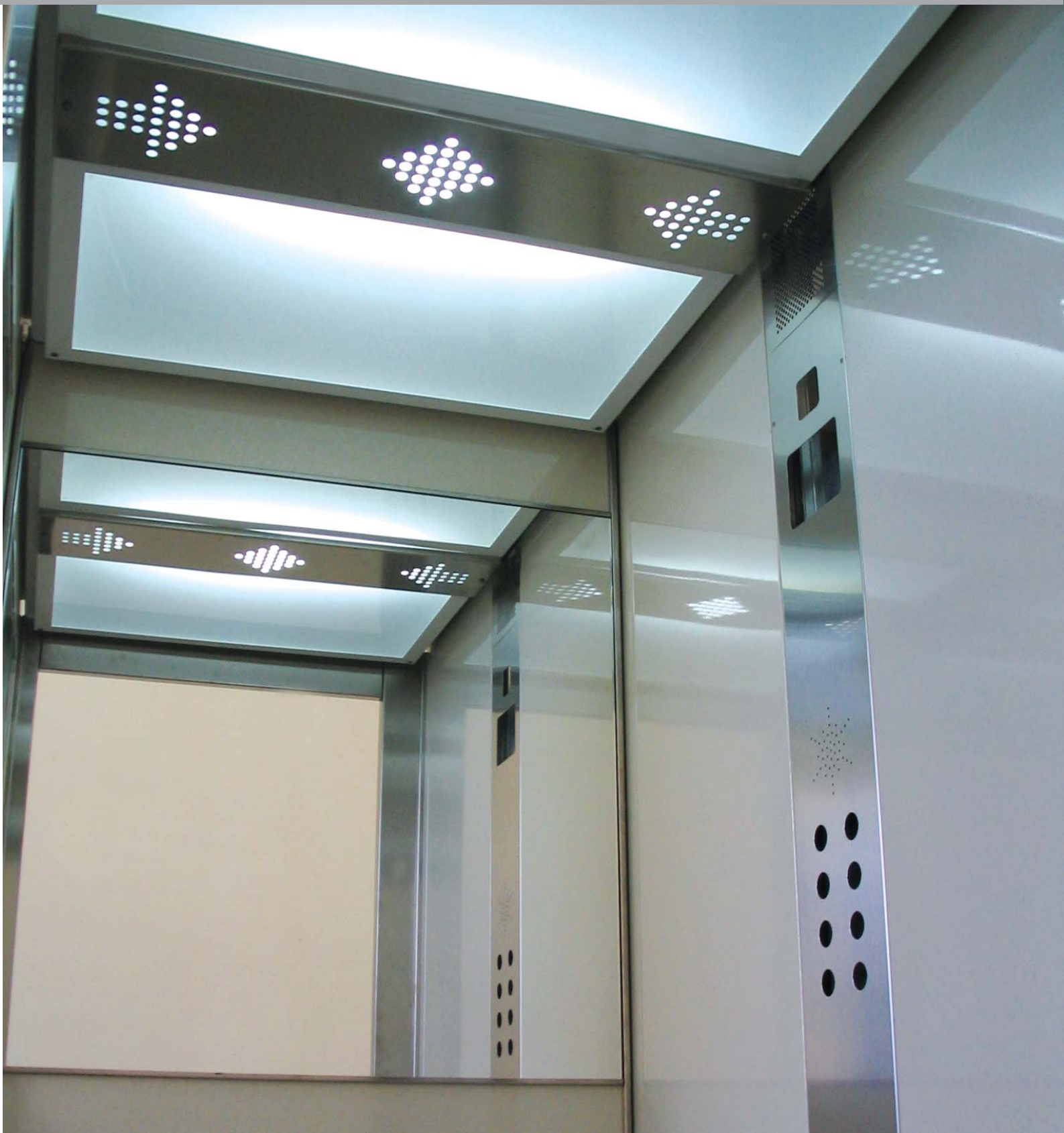
CABINA MODELLO AURORA