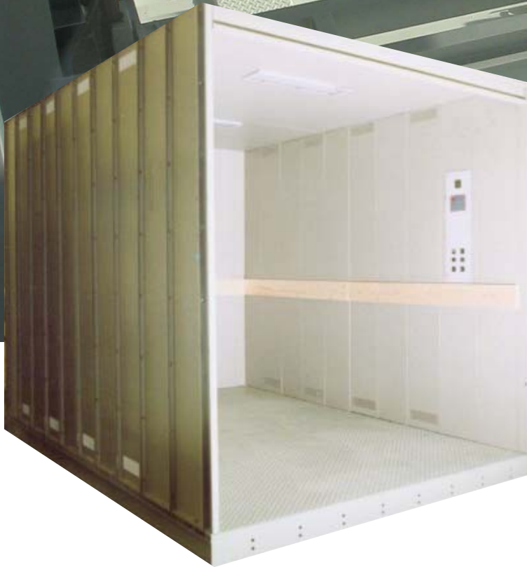
CABINA MODELLO MONTACARICO